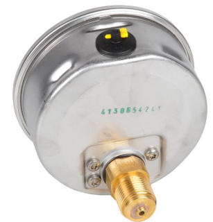
typ: M100TE/G model: 213.53.100TE