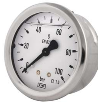
typ: M63T/G model: 213.53.063T