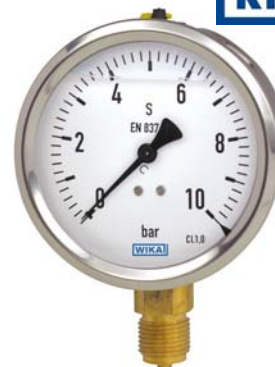
typ: M100R/G model: 213.53.100