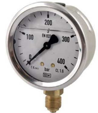
typ: M63R/G model: 213.53.063